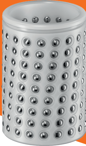
2060.41. FIBRO 带安全环凹 槽的滚珠轴承保持 架, 塑料