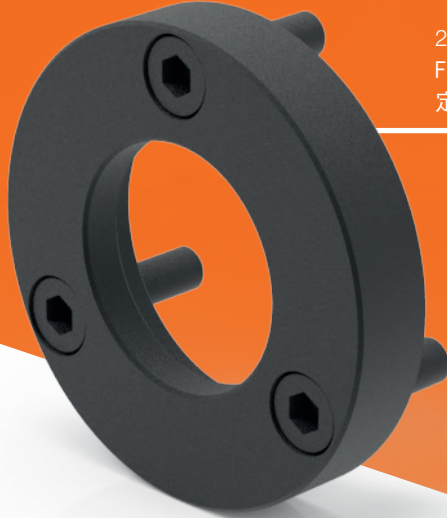
2021.45. FIBRO 有凸缘的导向杆固定环