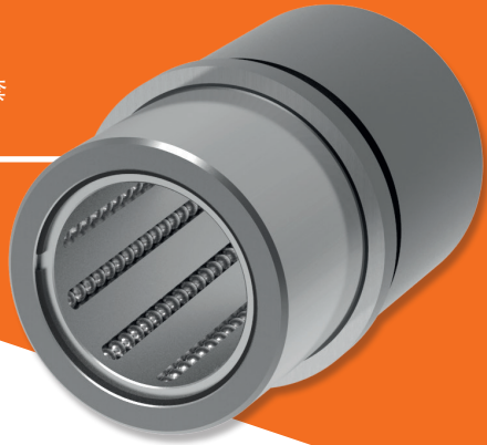
2081.69. .1 FIBRO 带凸缘的直线型球轴承衬套 ~ISO9448-7