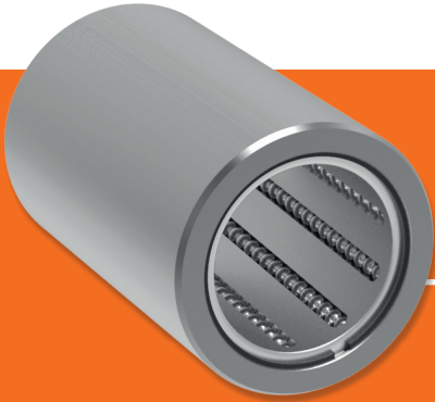
2061.69. .1 FIBRO 直线型球轴承衬套 ~ISO9448-3