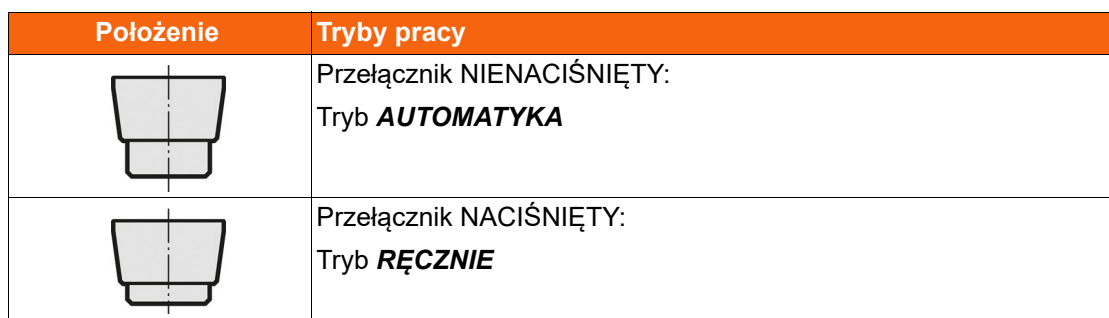
Tab. 6-1 Wybór trybu pracy

Ustawić tryb pracy przełącznikiem AUTOMATYKA / RĘCZNIE.