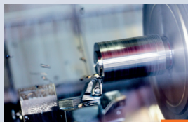
Produzione in serie ai massimi livelli con etichettatura e confezionamento personalizzati