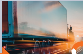
Servizio clienti e consegna affidabili, anche "just-in-time"