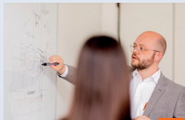
Supporto durante le fasi di ideazione e di progettazione

Sulla base di disegni tecnici, dati e specifiche, vi supportiamo nella realizzazione di soluzioni adatte alle vostre applicazioni e offriamo prodotti che rispecchiano gli standard più elevati per soddisfare i vostri requisiti.