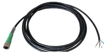
Fig. 3-5 Câble des signaux

Le câble des signaux relie l'unité de commande à un dispositif externe.