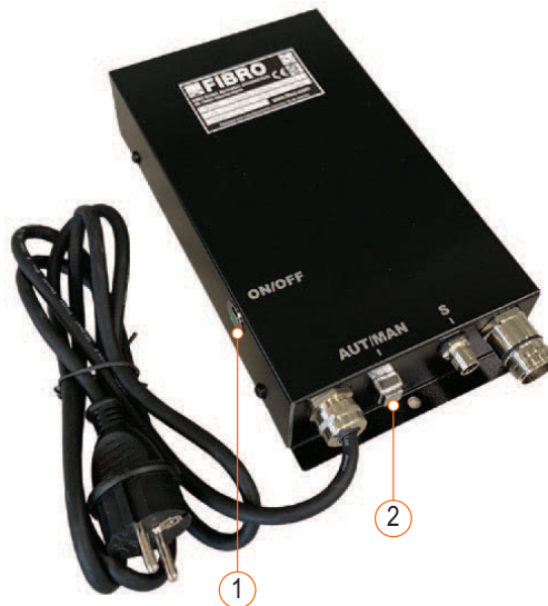
Fig. 6-1 Éléments de commande de l'unité de commande BLACK LINE