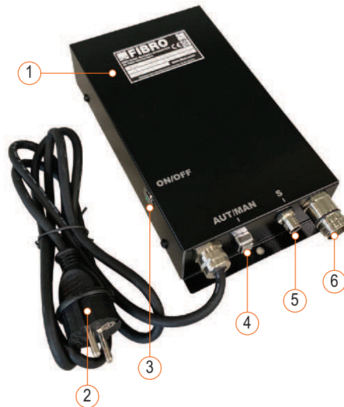
Fig. 3-1 Composants de l'unité de commande BLACK LINE