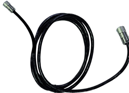
Fig. 3-4 Câble de jonction

Le câble de jonction relie l'unité de commande au transporteur électrique.