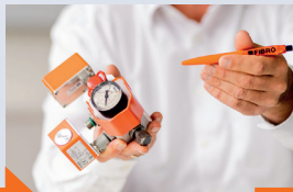
Desarrollo del producto desde la primera muestra hasta el producto final