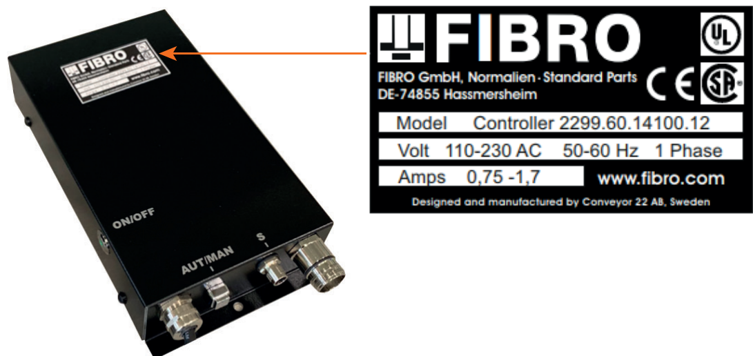
Abb. 3-3 Typenschild

Auf der Steuereinheit ist ein Typenschild angebracht. Zu allen Fragen und Bestellungen müssen die Angaben auf dem Typenschild mitgeteilt werden.