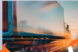
Zuverlässiger Kundendienst und Auslieferung, auch „just-in-time“