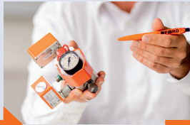
Produktentwicklung vom Erstmuster bis zum Endprodukt