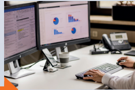
Kontinuierliche Kommunikation mit unseren Experten