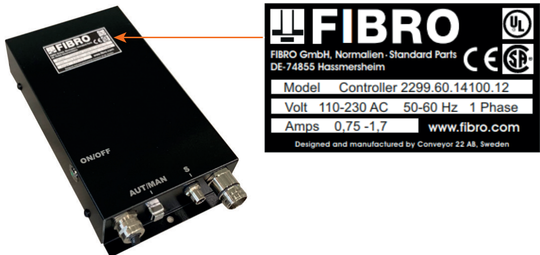
Obr. 3-3 Typový štítek

Na řídicí jednotce je umístěn typový štítek. U všech dotazů a objednávek je nutné sdělit údaje na typovém štítku.