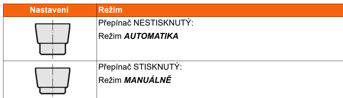
Tab. 6-1 Výběr druhu provozu

Nastavte režim na přepínači AUTOMATIKA / MANUÁLNĚ.